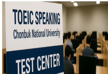
컴퓨터 모의고사 실제 시험장 & 피드백