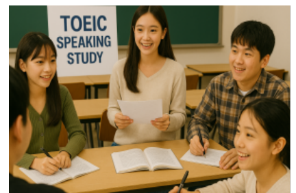
스터디 질리지 않고 즐겁게!