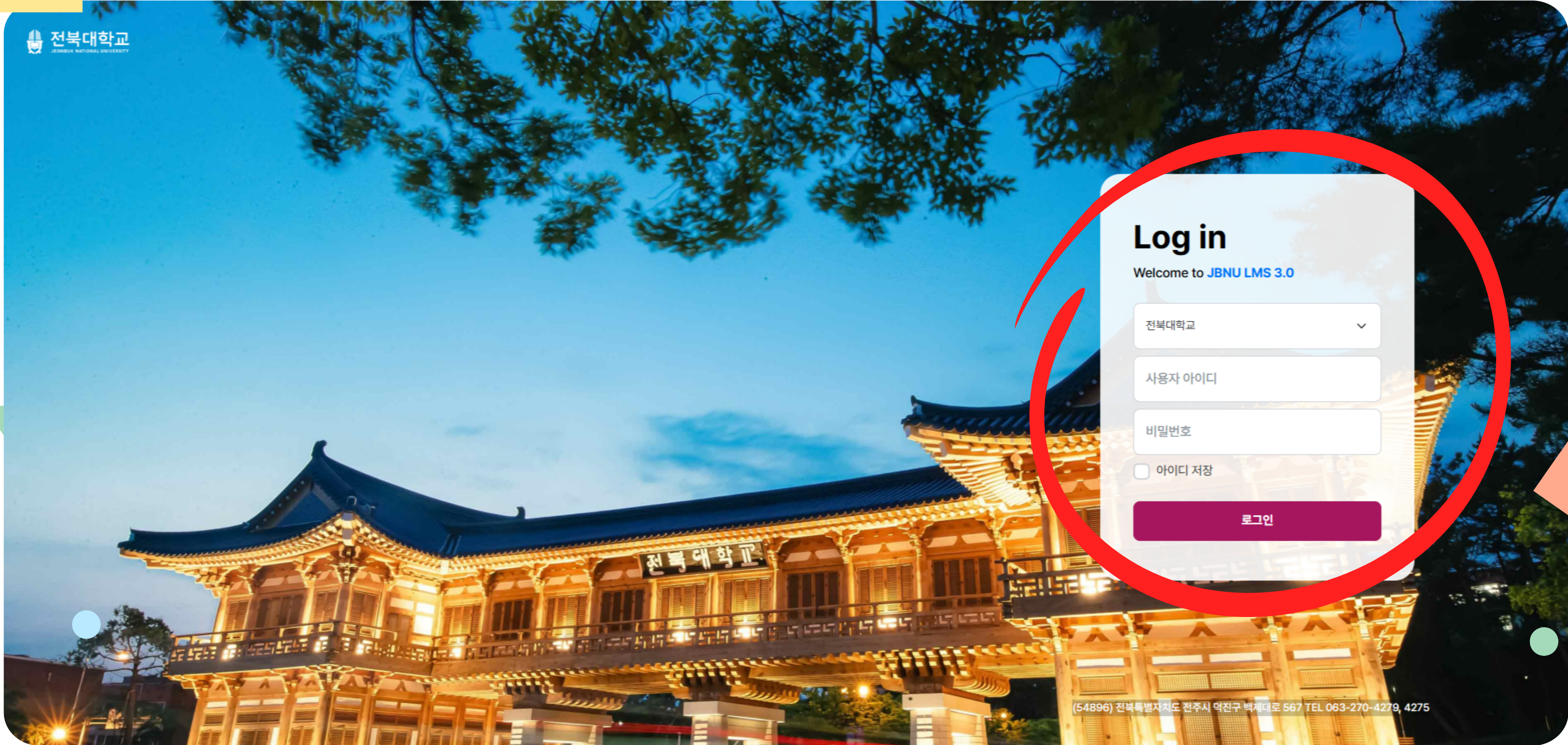
LMS Login Main Screen