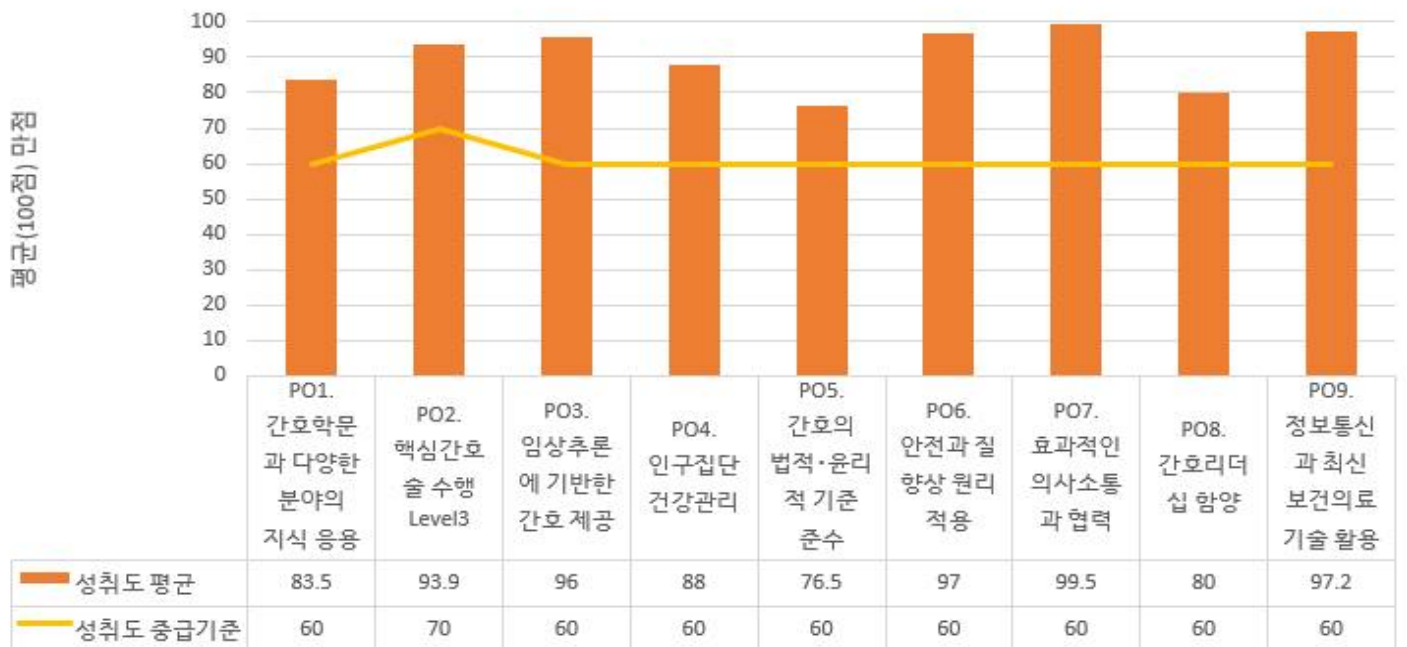
Phase II 프로그램 학습성과별 성취도 평가 결과(n=94)